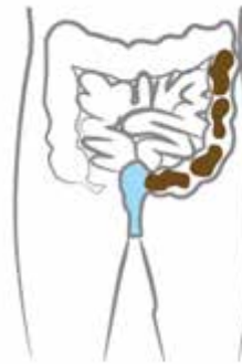
Kuva 1. Perinteiset menetelmät